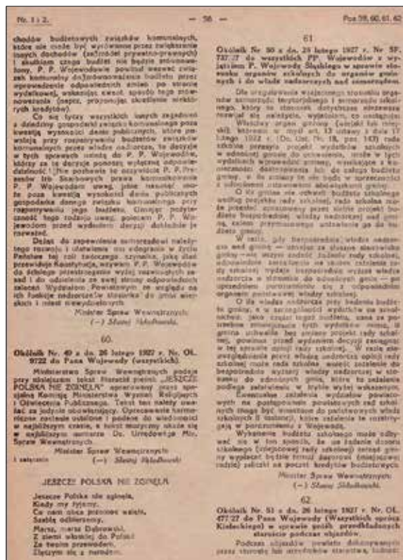
Ryc. 6. Okólnik Ministerstwa Spraw Wewnętrznych nr 49 z 26 lutego 1927 r.

Za Ministra, Kierownika Ministerstwa Wyznań Religijnych i Oświecenia Publicznego: St. Gayczak Podsekretarz Stanu 63 .