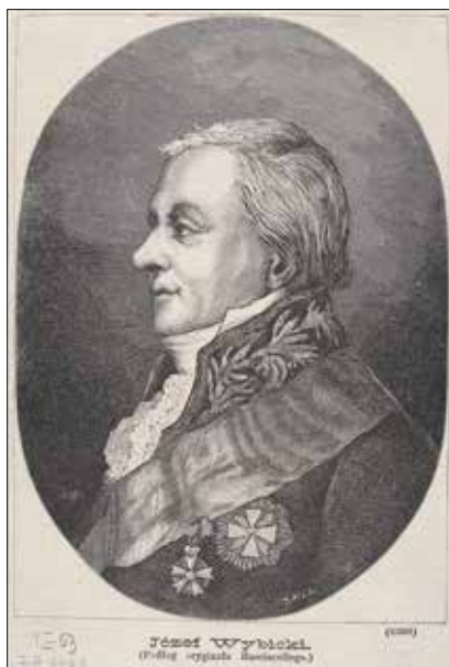
Ryc. 1. Józef Wybicki (1747–1822) – rycina według Marcello Bacciarellego (1731–1818)