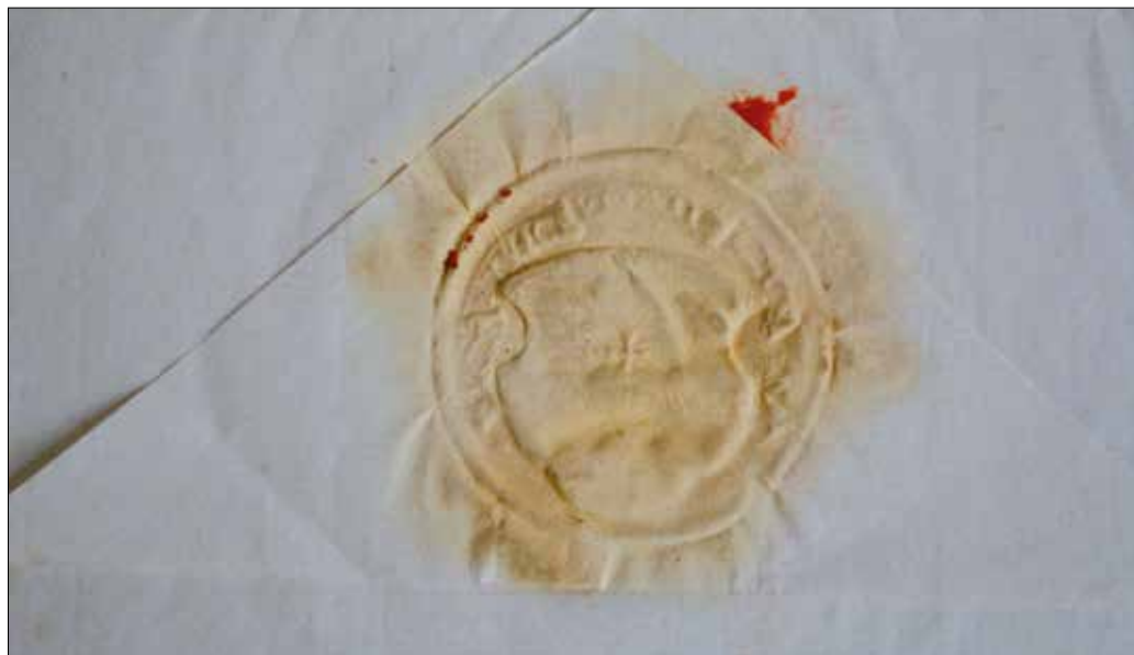
Fot. 2. Pieczęć opłatkowa na kopercie listu rady Chełmna do magistratu Torunia z 1766 r., średnica 35 mm (Muzeum Ziemi Chełmińskiej, sygn. MZCH/D/313)